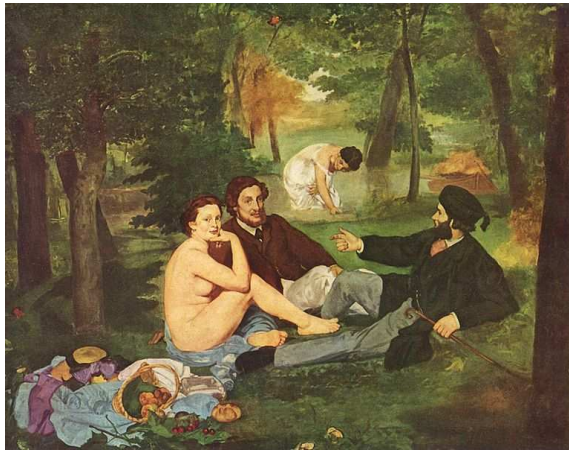
EDOUARD MANET. LA COLAZIONE SULL'ERBA. 1863. OLIO SU TELA. CM 208X267. PARIGI, MUSEO D'ORSAY

La tela "Le déjeuner sur l'herbe" di Edouard Manet fu al centro di un vero e proprio scandalo. La provocazione si poneva sia sul piano formale che su quello contenutistico. Esponi in 12 righe la carica innovativa di tale opera e come riuscì a coniugare temi e iconografie del patrimonio pittorico classico con uno stile del tutto nuovo.