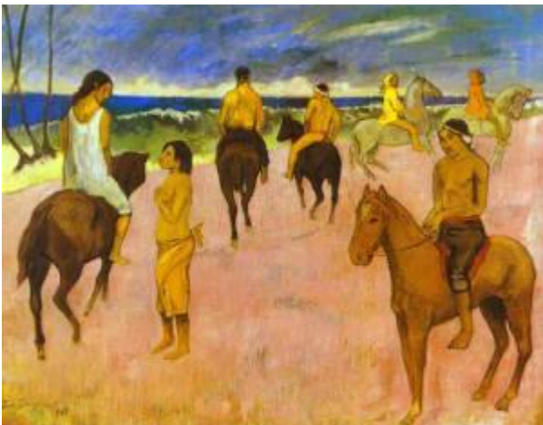
Paul Gauguin, Horsemen on the Beach . 1902. Oil on canvas. Stavros Niarchos collection.