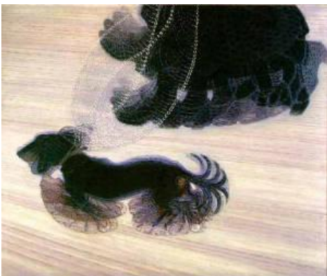
Giacomo Balla, Dynamism of a Dog on a Leash , 1912