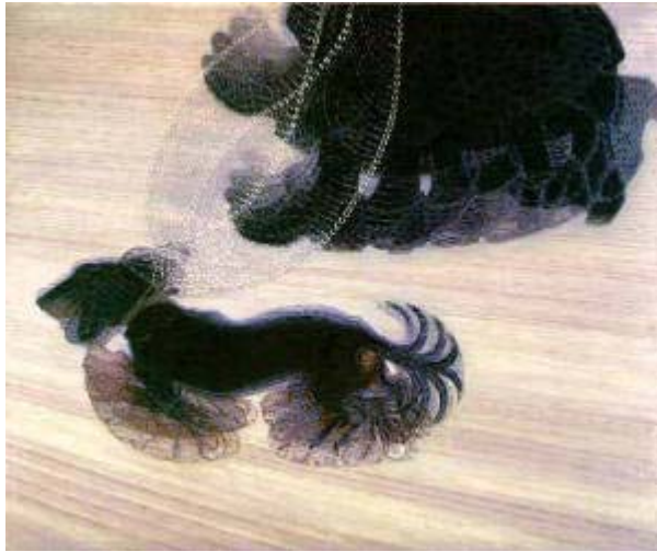
Giacomo Balla, Dynamism of a Dog on a Leash , 1912