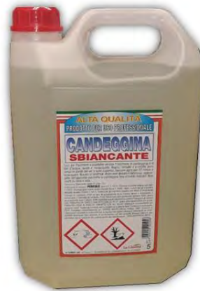
CANDEGGINA (ipoclorito di sodio) 0,5%

SE VUOI UTILIZZARE PRODOTTI DIVERSI DEVI FARTI ATTESTARE PER ISCRITTO DAL PRODUTTORE / FORNITORE CHE HANNO CARATTERE VIRUCIDA NEI CONFRONTI DEL CORONAVIRUS SARS-COV 2