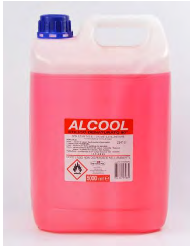
ALCOOL ETILICO 75%

I prodotti da utilizzare per la sanificazione (dopo le normali pulizie) sono: